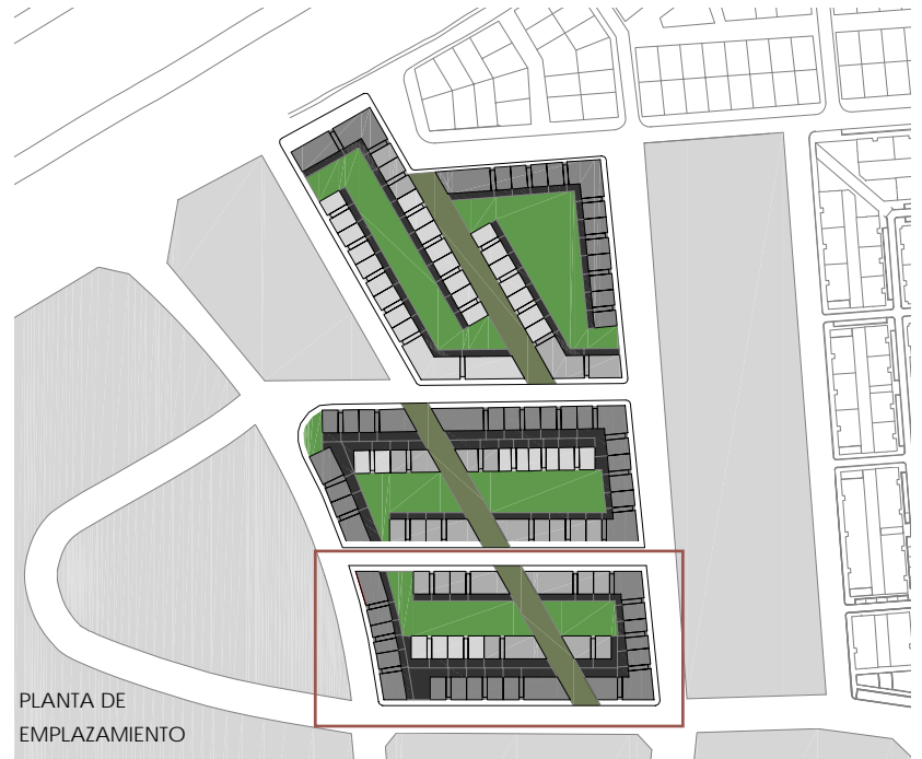
PLANTA DE EMPLAZAMIENTO